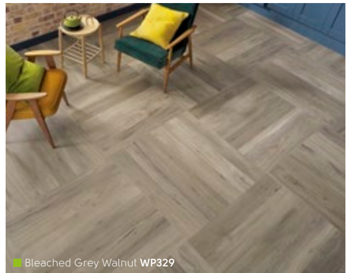
Bleached Grey Walnut WP329