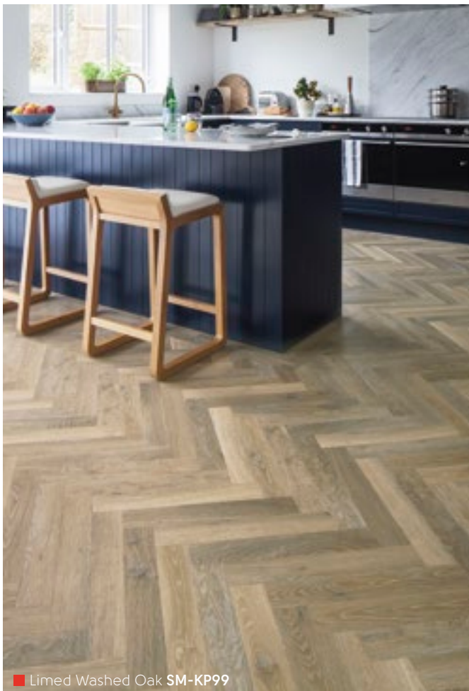
Limed Washed Oak SM-KP99